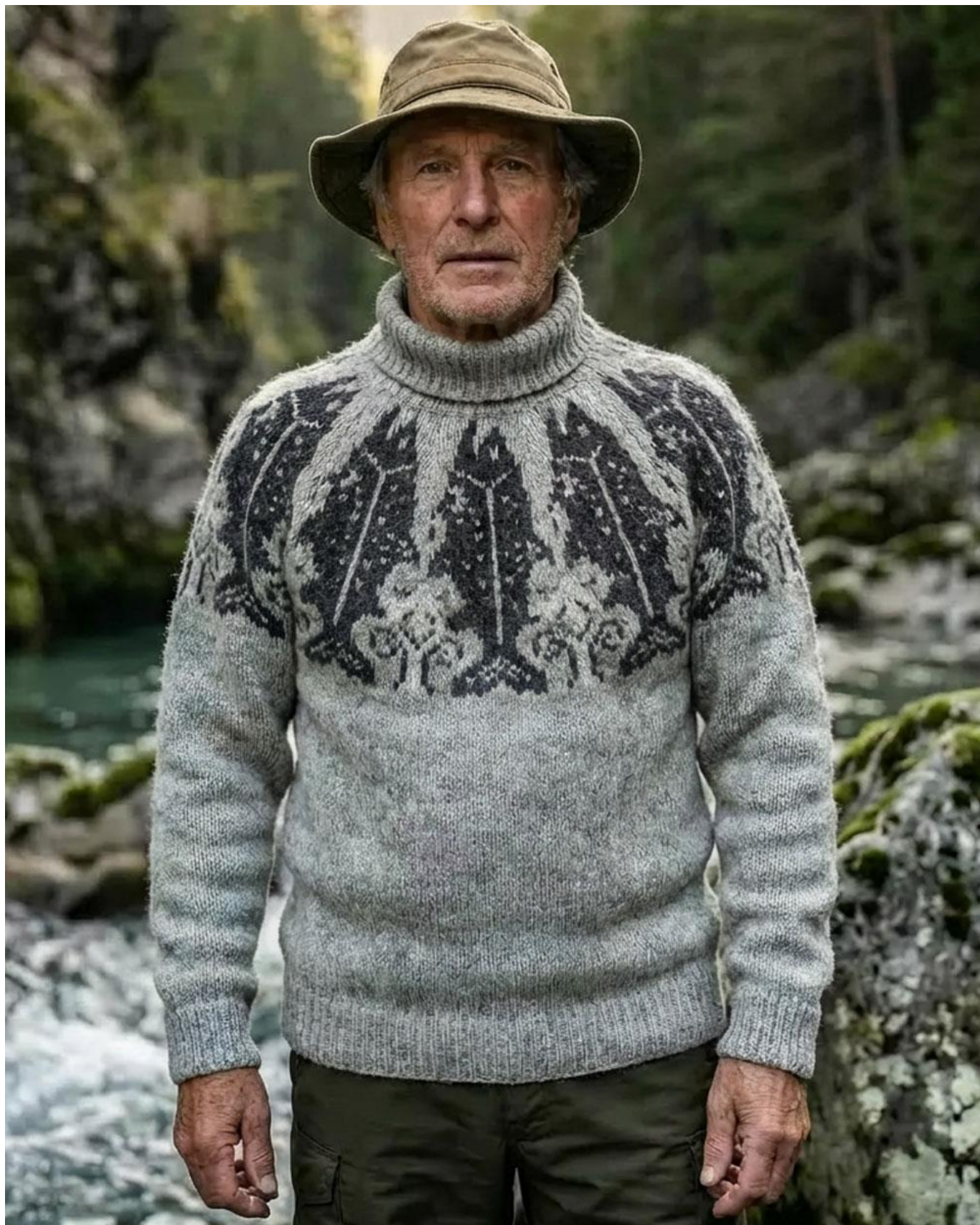
LAKSEFISKER GENSEREN DLG 25-037